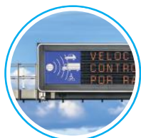
tablice zmiennej treści