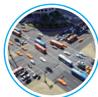
czujniki natężenia ruchu